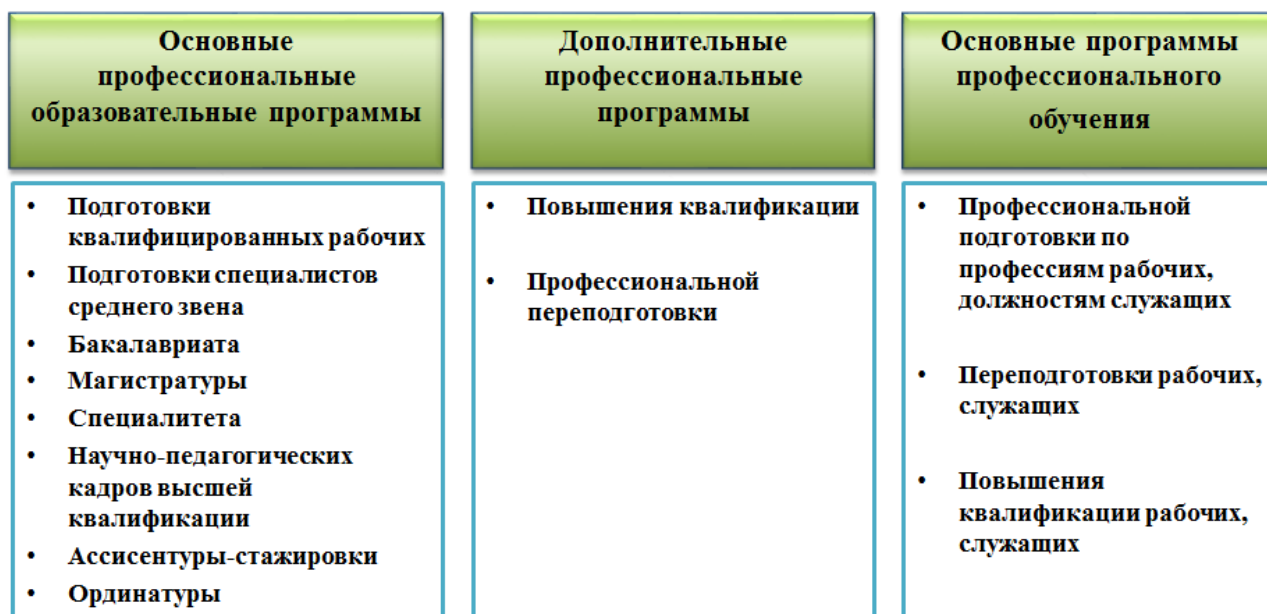
Рисунок 12 – Виды образовательных программ, ведущие к присвоению квалификации

Сопоставление структурных элементов образовательной программы с компонентами профессионального стандарта схематично можно представить на рисунке 13.