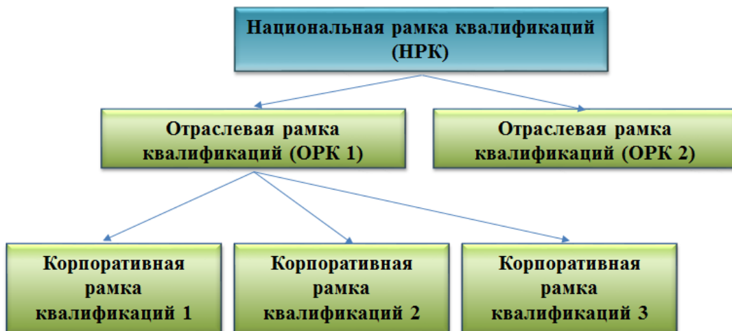
Рисунок 5 – Иерархия рамок квалификаций

сегодня на национальном, отраслевом и корпоративном уровнях.