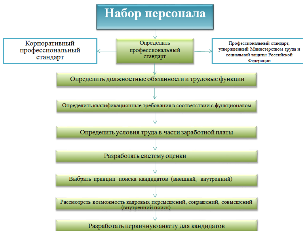
Рисунок 9 – Алгоритм применения профессиональных стандартов в процессе набора персонала