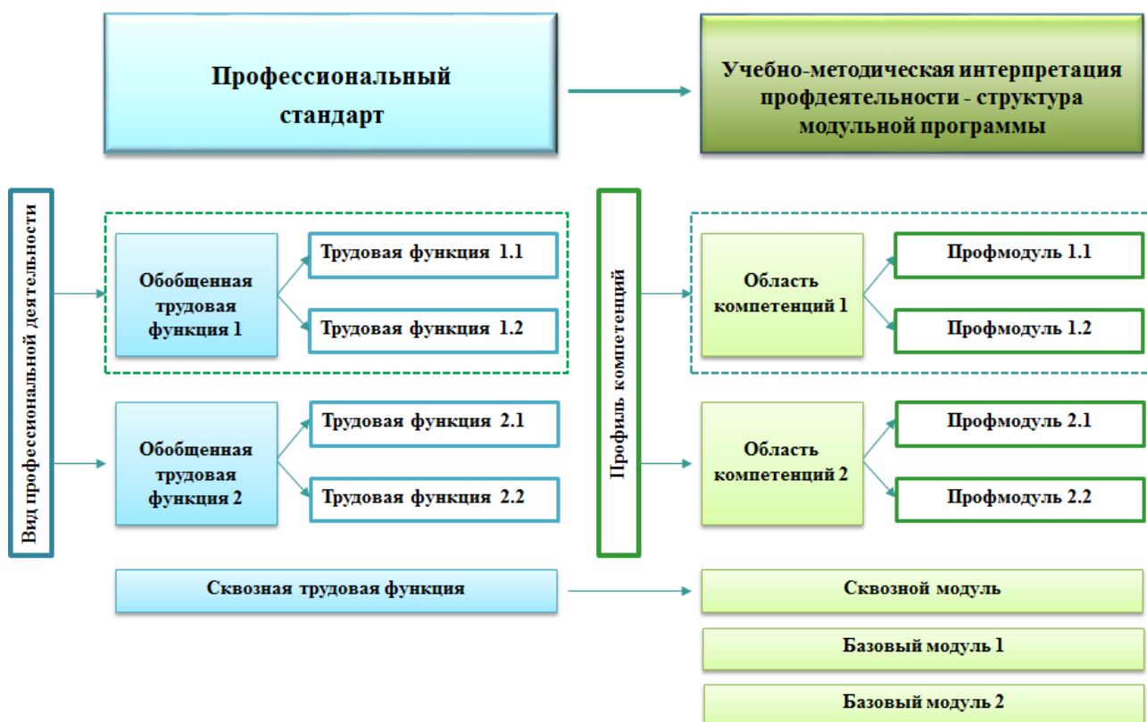
Рисунок 14 – Схема проекции профессионального стандарта в модульную программу обучения

В приведенной ниже структуре видно, что трудовые функции как самостоятельные структурные компоненты профессионального стандарта становятся модулями образовательной программы. Далее структура образовательной программы может варьироваться в зависимости от ее задач, целевой аудитории, образовательных условий. Например, возможно создание укрупненных модулей обучения, включающих в себя несколько трудовых функций профессионального стандарта.