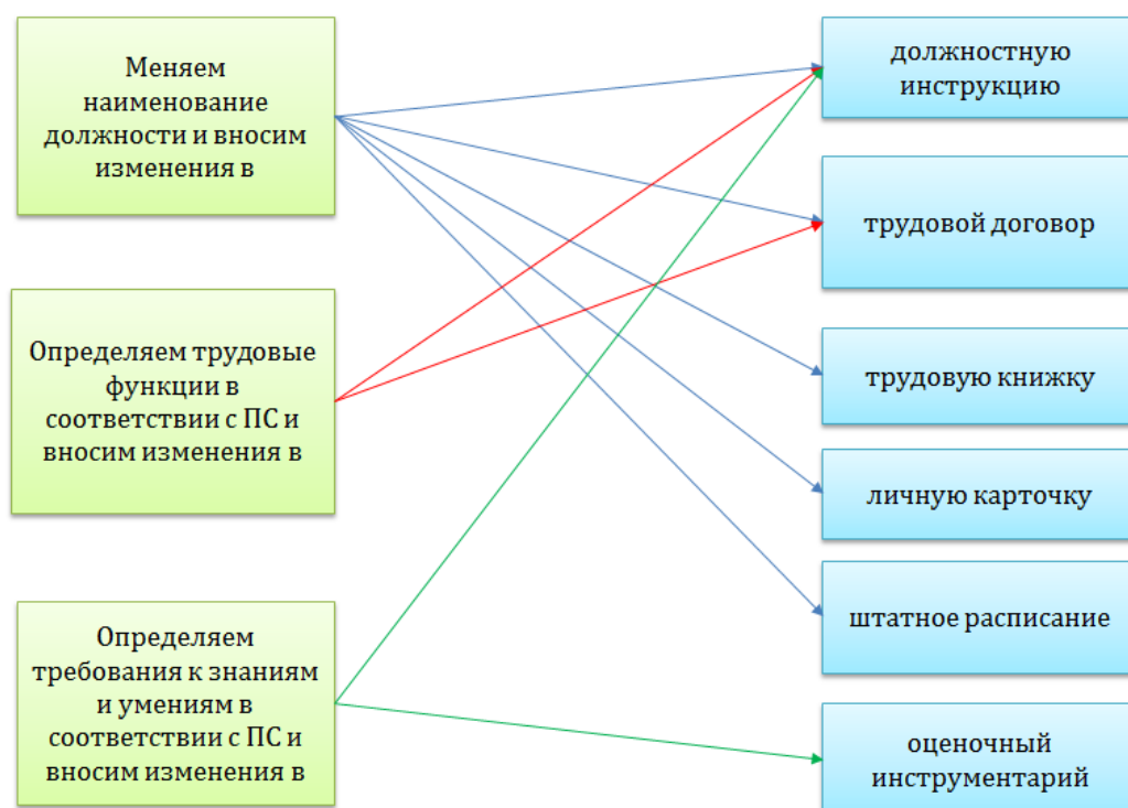
Рисунок 8 – Схема изменения кадровой документации

В общем плане процесс изменения кадровой документации можно представить схематично на рисунке 8.