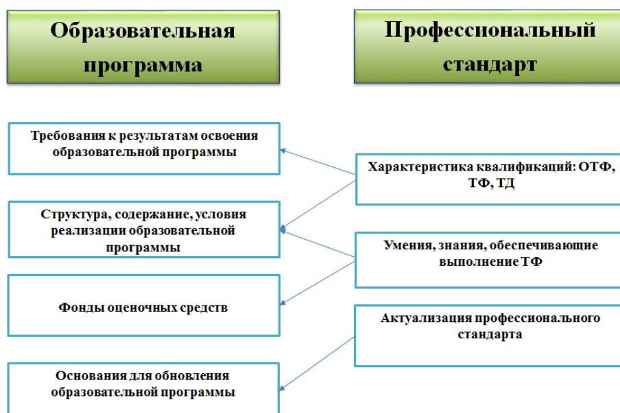
Рисунок 13 – Связь образовательной программы и профессионального стандарта

Сопоставление структурных элементов образовательной программы с компонентами профессионального стандарта схематично можно представить на рисунке 13.