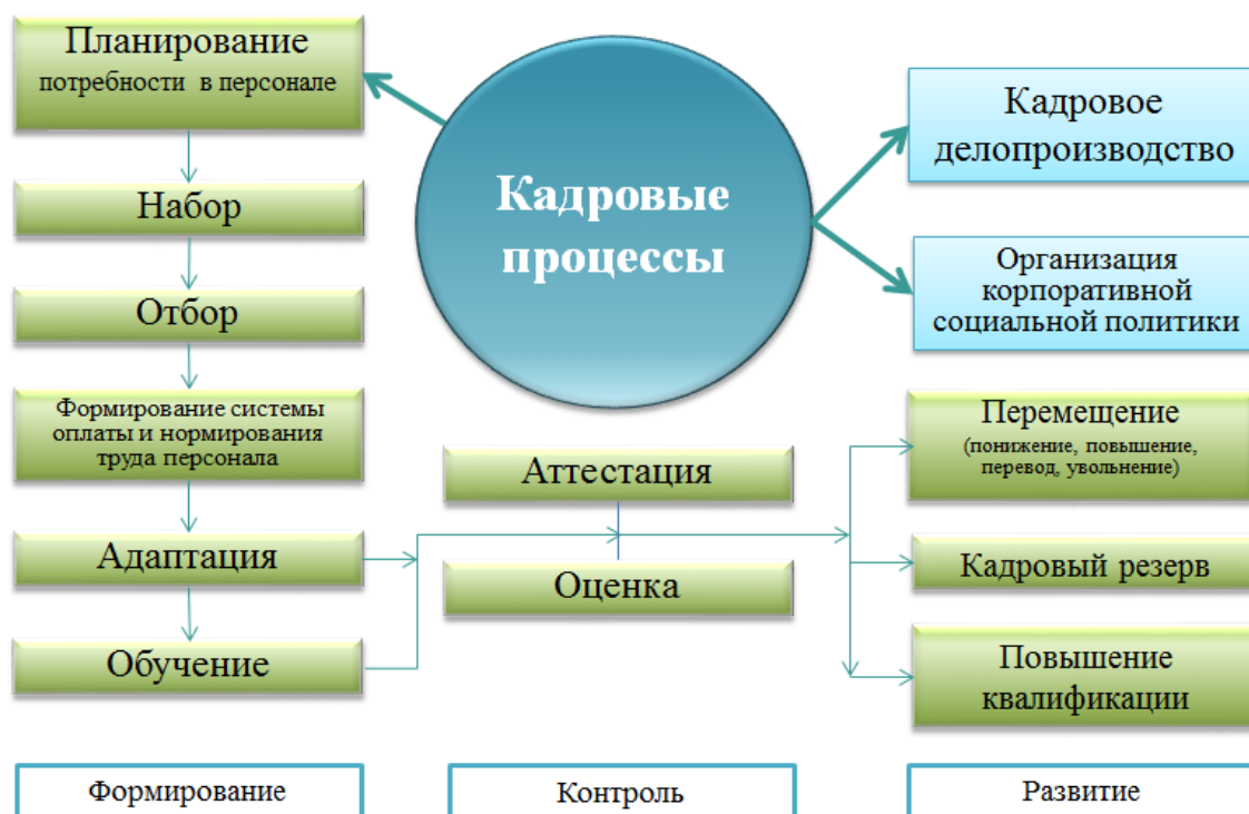
Рисунок 6 – Схема кадровых процессов в организации

5) Организация корпоративной социальной политики.