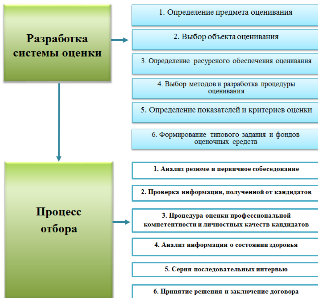
Рисунок 90 – Процесс отбора кандидатов на вакантную должность

Базовые критерии, как правило, заложены в анкете кандидата, и их легко можно оценить в ходе анализа резюме и личного собеседования на первом этапе отбора.